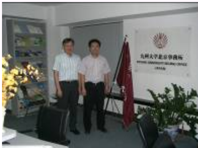
南石教授との記念撮影

8月20日(月)から8月23日(木)にかけて、日本九州大学農学研究院農業資源経済学部門南石晃明教授と前田幸嗣準教授が、中国との共同研究の打ち合わせのため、来京。中国人民大学への訪問や、東アジア農業資源環境フォーラムの協議会を終えて、8月21日に仕事の隙を縫いで北京事務所を訪れた。北京事務所の運営現況や方針などについて、宋敏所長と情報交換を行い、今後の協力に意見交換した。