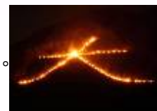
大文字の送り火(京都)

盆の入り(13日)の夕方、家の前で火を焚き祖先の霊を迎える。これが迎え火。盆明け(16日)の夕方に火を焚いて祖先の霊を帰す。これが送り火。このほか、お盆の最も大きなイベントは、盆踊りを踊ること。徳島県の阿波踊りは特に有名。