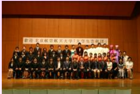
両大学で記念撮影