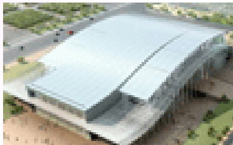
国家体育館の鳥瞰図

2008年オリンピックの主要な競技会場の1つである国家体育館は、敷地面積が2.49万平方メートル、延べ床面積が8.09万平方メートルを誇る。2008年五輪の体操やハンドボールの競技で用いられる。同体育館は2005年5月28日に着工した。今年10月に完工するとみられている。